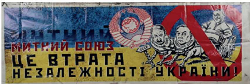
Іл. 4. Плакат із конструкції ялинки.

Інтереси Москви у відмові України від асоціації з ЄС, входження до пропонованого РФ утворення — Митного союзу, — та наслідки цього кроку для України також усвідомлювалися протестувальниками. Серед плакатів Майдану були такі: «Мутний / Митний союз — втрата незалежності України» (іл. 4) або «На 300 років знову у ярмо» 7 .